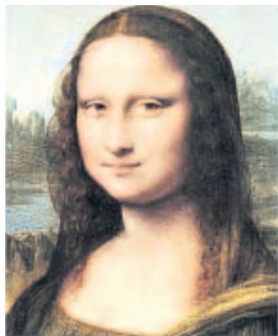
Der Meister und sein Werk: Leonardo Da Vinci (1452 – 1519) auf einem Selbstporträt neben seiner „Mona Lisa“.