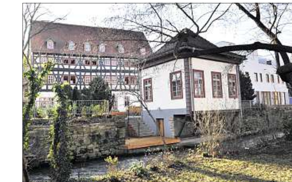
HISTORISCH: Die Bäume für das Fachwerk des Hauses in der Drachengasse wurden im 16. Jahrhundert geschlagen.

Von einer Insel des Breitstroms aus offenbart sich der Komplex Drachengasse 1 von seiner schönsten Seite. Wo am